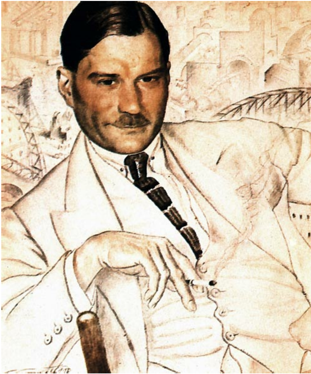
Boris Kustodijev: Portret pisca Jevgenija Zamjatina (1923.)